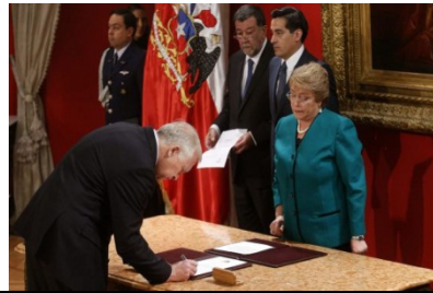
ACTIVIDAD DE LAS AUTORIDADES