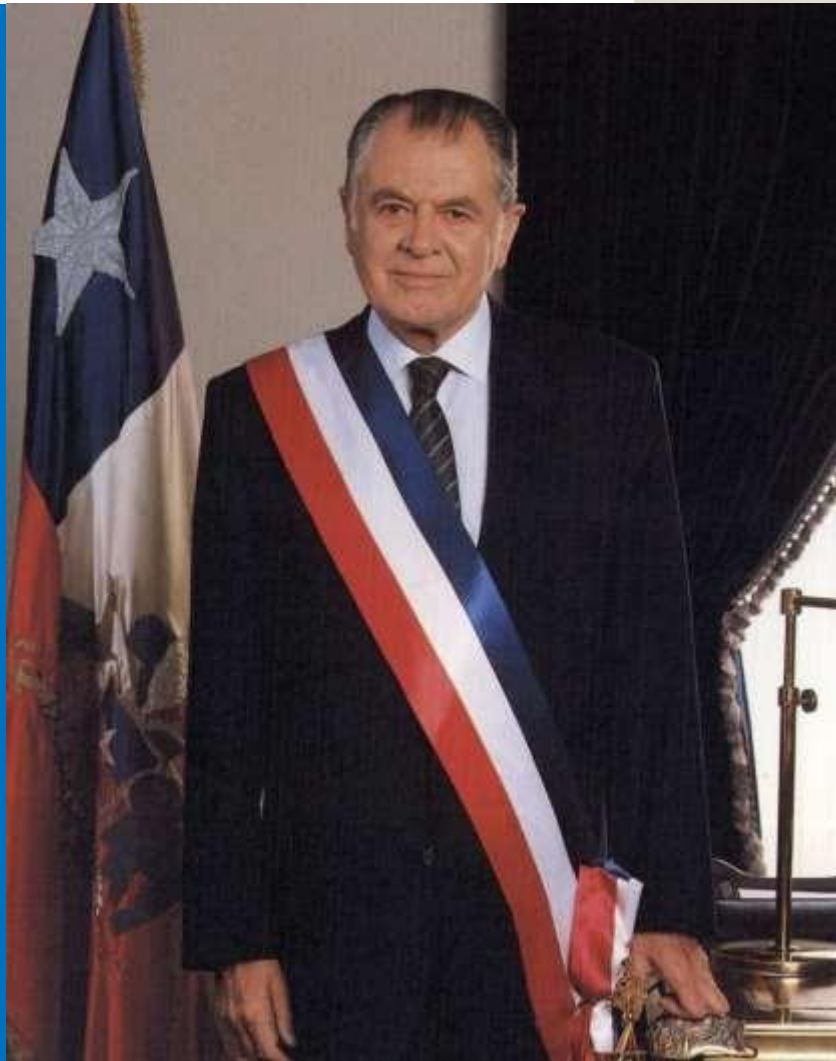
PATRICIO AYLWIN AZÓCAR (1990-1994)