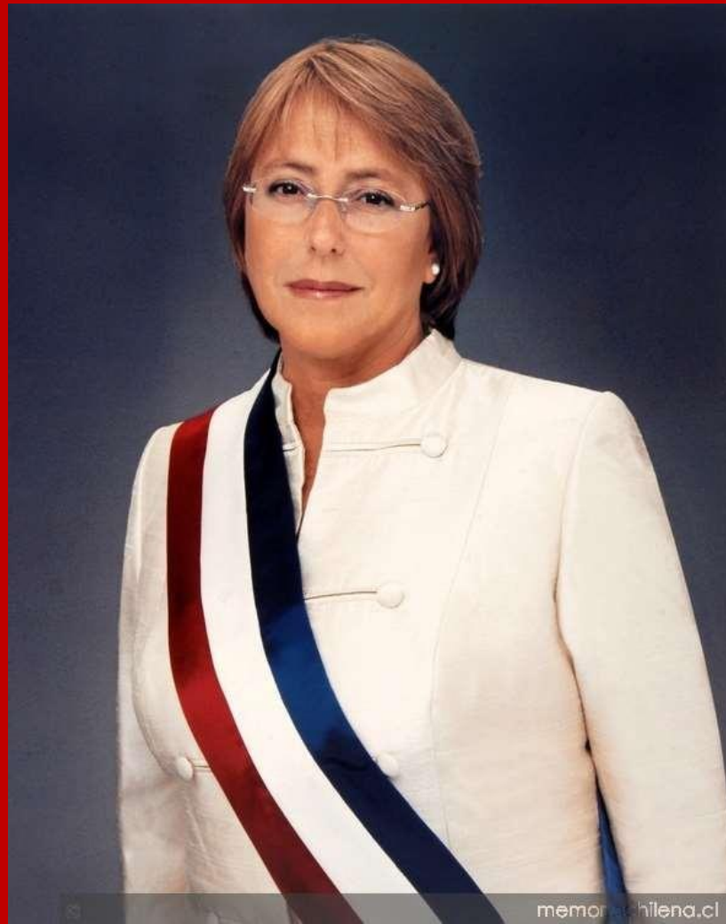
MICHELLE BACHELET JERIA (2006-2010)