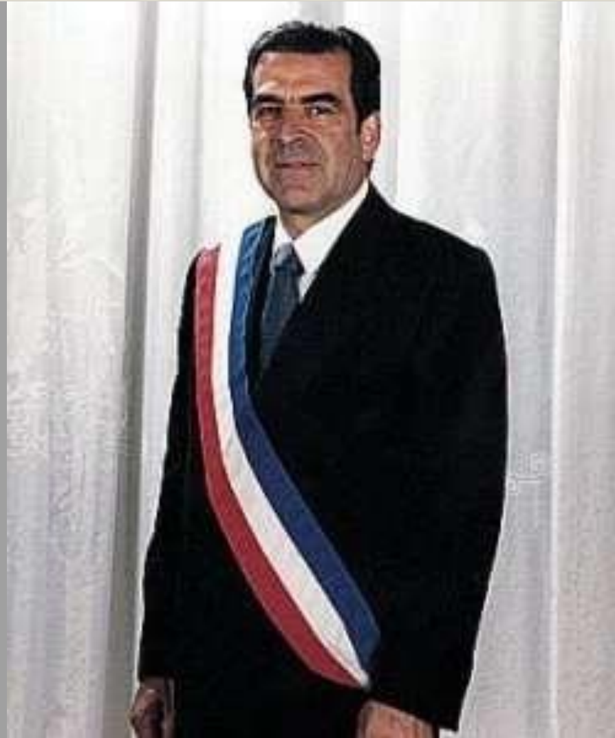
EDUARDO FREI RUIZ-TAGLE (1994-2000)