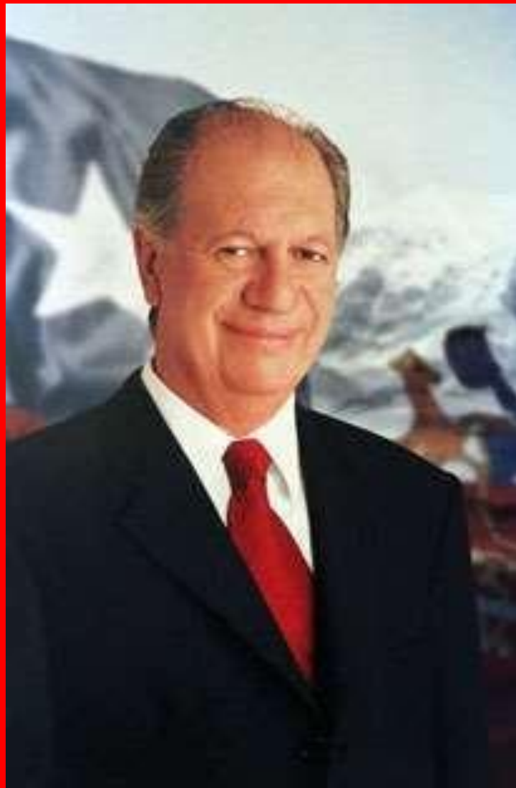
RICARDO LAGOS ESCOBAR (2000-2006)