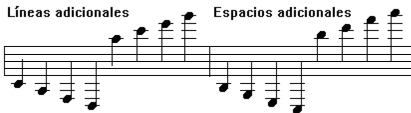
Figura 2. Líneas y espacios adicionales.

A este pentagrama musical se le pueden añadir más líneas y espacios a través de lo que se conoce como líneas adicionales . Hay veces que las notas exceden el ámbito del pentagrama, es por eso que es necesario el uso de estas líneas adicionales.