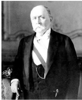
Ramón Barros Luco 1910-1915