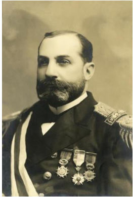
Jorge Montt 1891-1896