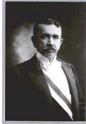
Federico Errázuriz 1896-1901