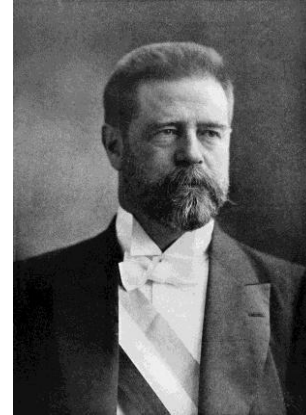
Germán Riesco 1901-1906