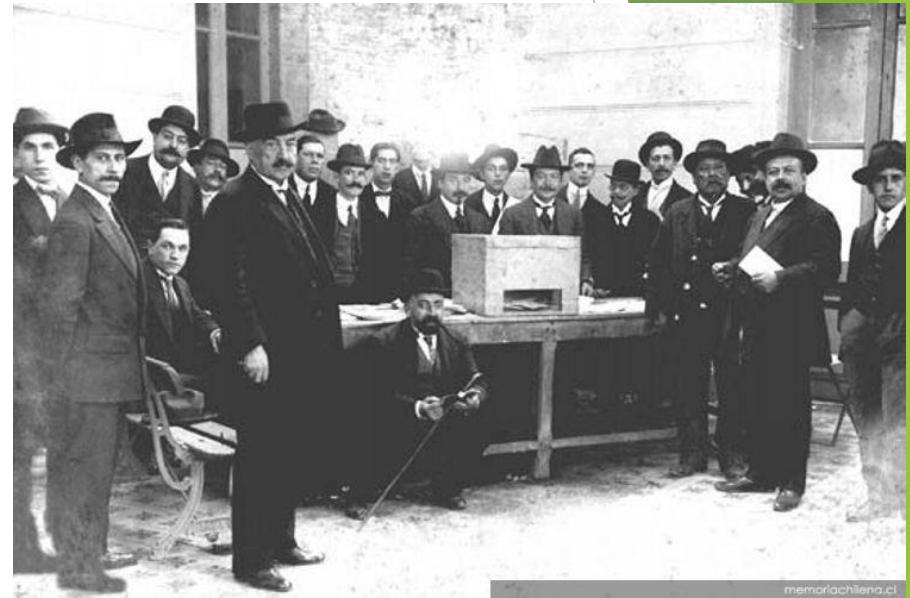
Mesa de votación a inicios del siglo XX