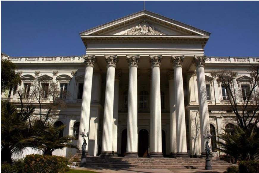
Sede del ex Congreso Nacional en Santiago