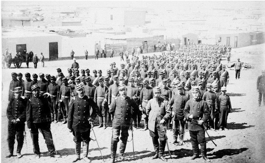
Militares chilenos en el siglo XIX