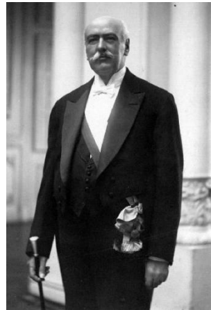
Juan Luis Sanfuentes 1915-1920