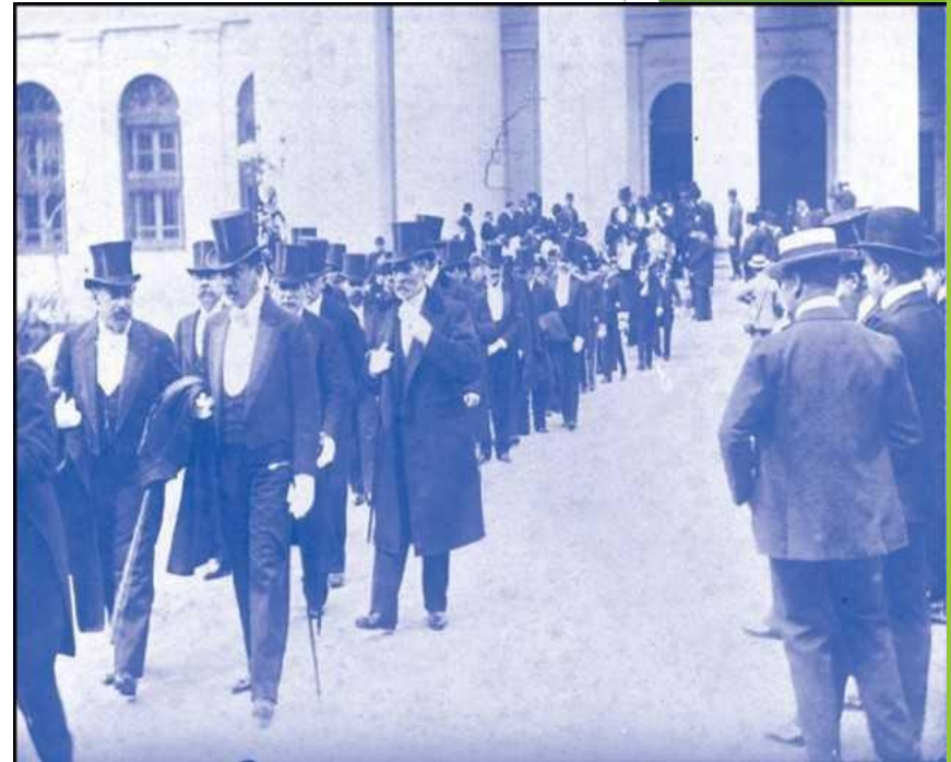
Parlamentarios en la sede legislativa