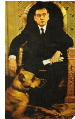
Arturo Alessandri 1920-1925