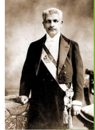
Pedro Montt 1906-1910