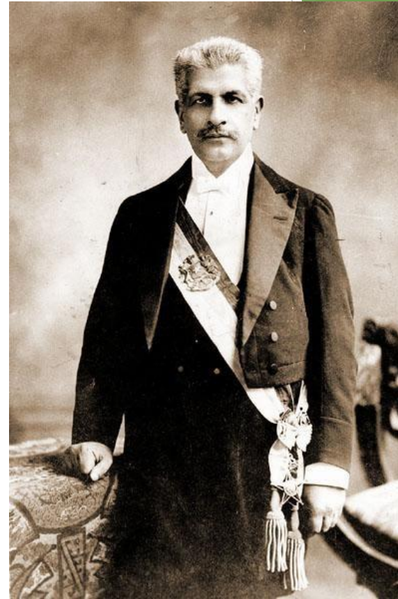
Pedro Montt Montt, presidente entre 1906 y 1910